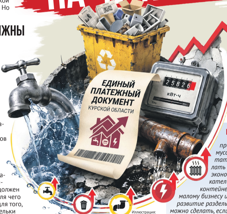
Иллюстрация: Алексей Бенев

«Как депутат Курской областной Думы я направил предложение в Минстрой России, чтобы собрания собственников проводились в очно-заочной форме и на всех подобных мероприятиях присутствовали специалисты Госжилинспекции, ответственные от органов исполнительной и представительной власти. Также необходимо ужесточить наказание для застройщиков за неисполнение гарантийных обязательств»