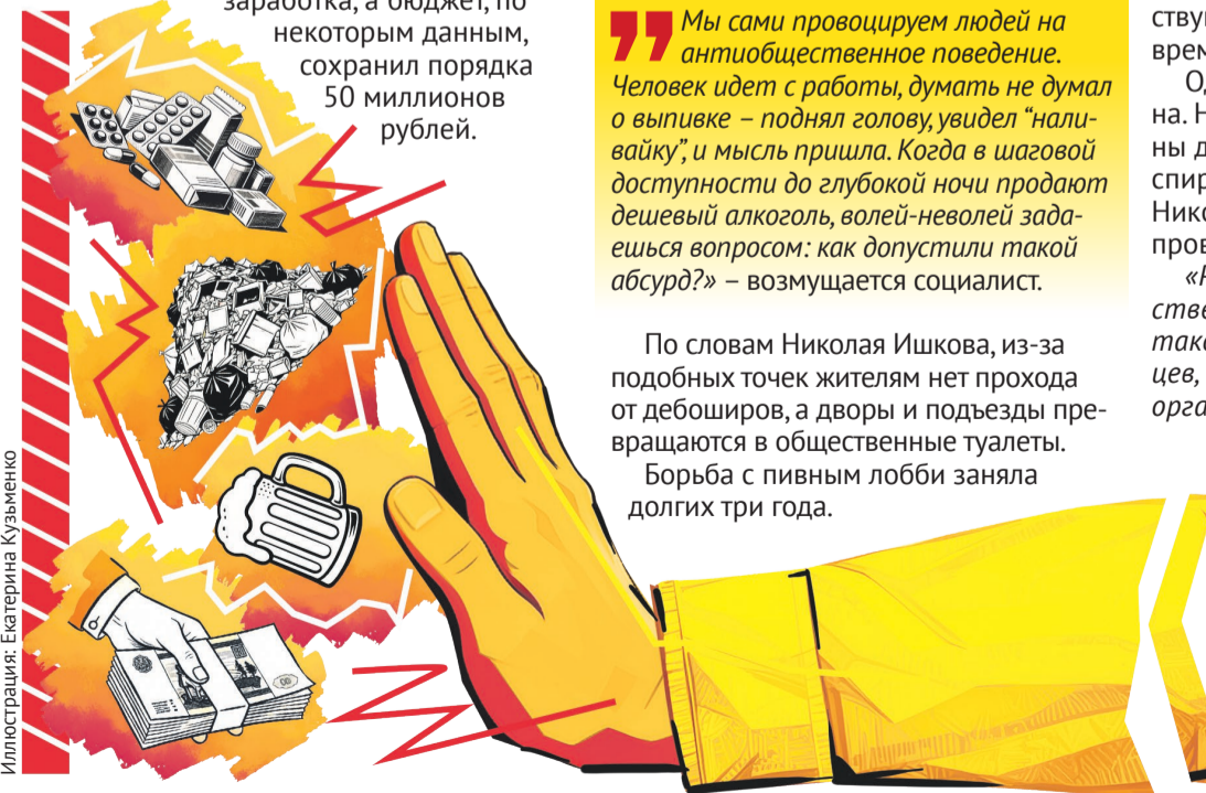
Иллюстрация: Екатерина Кузьменко

«Тут даже дело не в том, кто настоящий владелец и получает выгоду. Ну выполни ты работу – и вопросов не будет. Так повелось с прежних времен, что у нас кругом на подрядках кум, сват или брат. Они считают, что им можно ничего не делать, и никто слова не скажет. Скажут. Время прогремели коррупционные скандалы бывшей администрации Курской области о крышевании и взяточничестве. Речь идет о сотнях миллионов рублей, украденных из бюджета».