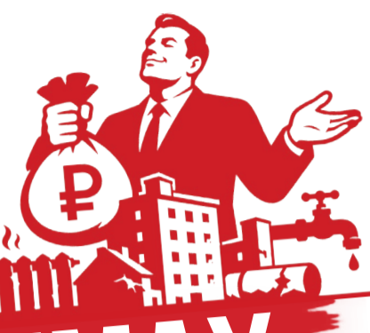
Иллюстрация: Алексей Бенев

Курская область – это целый букет коммунальных проблем: от провальной зимней уборки улиц и забытых мусором полигонов до ржавых водопроводов и непомерно высоких тарифов. Мириться с этим и пустить пенсионеров и малоимущих по миру? Или все же прислушаться к курским справедливороссам?