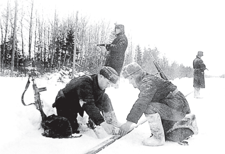
Минирование железнодорожных путей партизанами