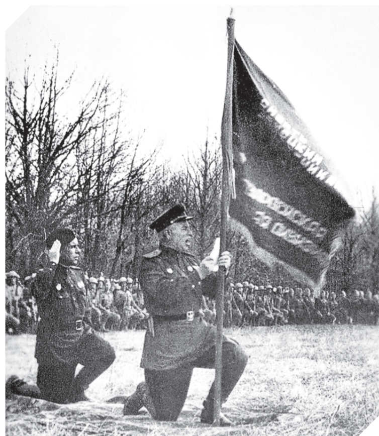
Бойцы принимают присягу. Северный фас Курской дуги. Весна 1943 г.

Отряд им. Боженко был создан в мае 1942 года (выделен из отряда № 1 им. Ворошилова). Отряд им. Боженко состоял из жителей Хомутовского района, в нем на-