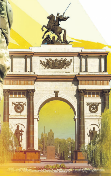
Фото: 123rf.com, Надежда Чичерова, коллаж: Алексей Беленёв