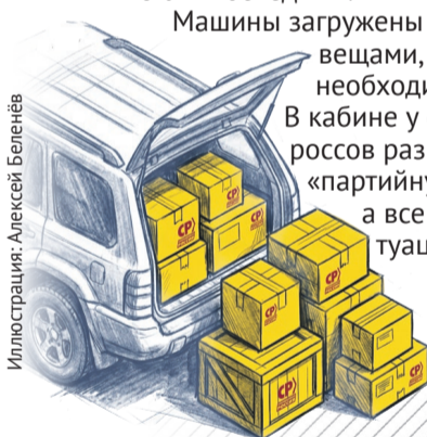
Иллюстрация: Алексей Беленёв

Машины загружены под завязку вещами, которые так необходимы фронту. В кабине у справедливороссов разговоры не про «партийную линию», а все больше о ситуации в зоне СВО, о продвижениях наших войск.