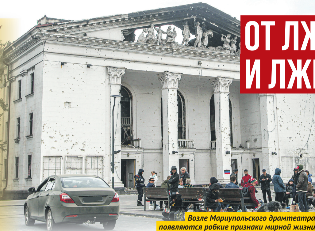
Возле Мариупольского драмтеатра появляются робкие признаки мирной жизни