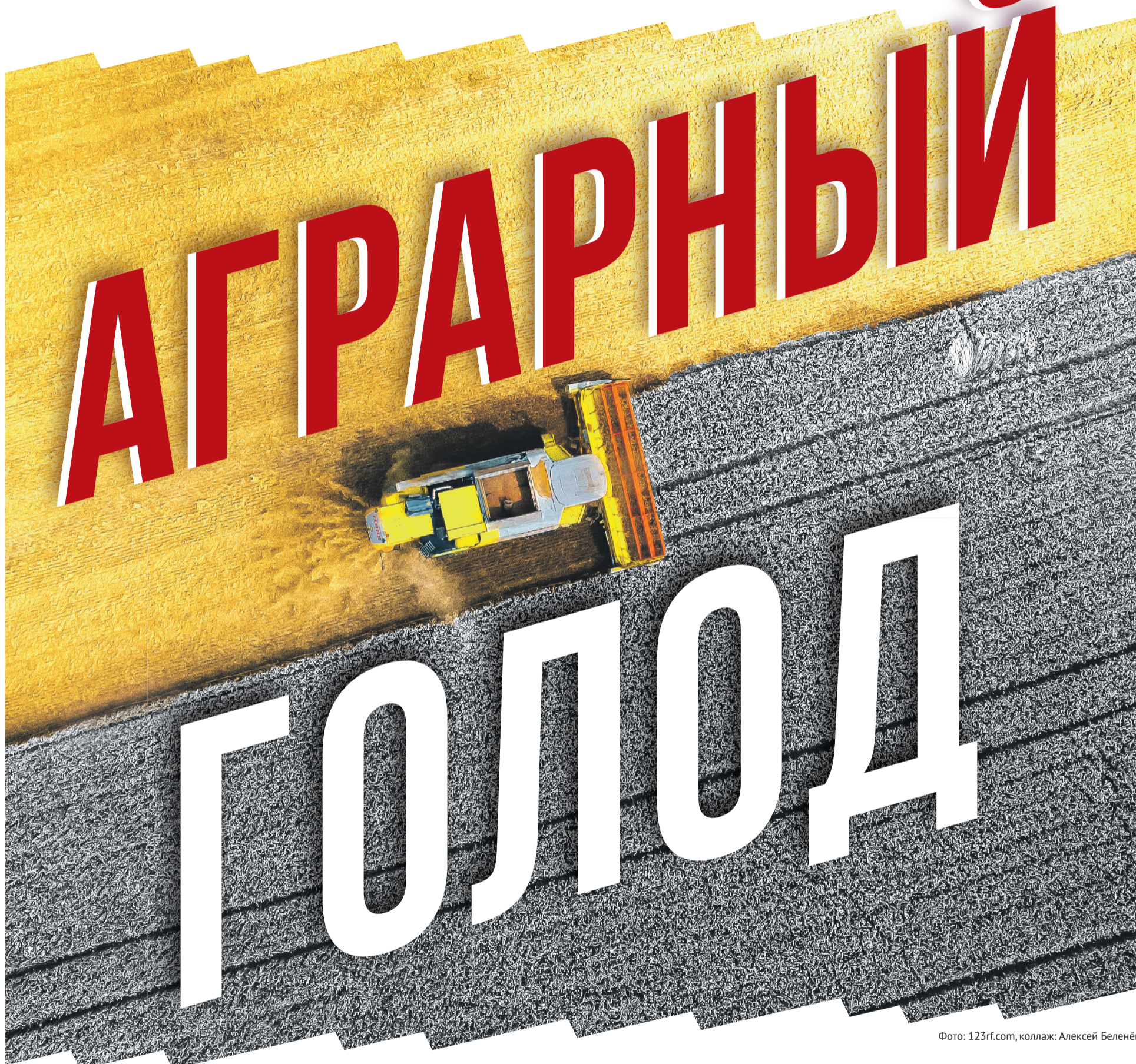
Фото: 123rf.com, коллаж: Алексей Беленёв

Импортозамещаемся по полной программе, а кто будет пахать и сеять – не решили. Казалось бы – вот оно, второе дыхание для фермеров и совхозов. Только в аграрной стране задыхаются и фермеры, и совхозы – без комбайнёров, механиков, зоотехников и агрономов. Как уничтожали советскую систему подготовки кадров для сельского хозяйства и что делать теперь?